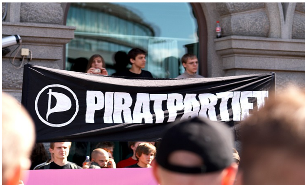
Piratenpartei in Schweden

In Deutschland nimmt die Piratenpartei im Januar 2008 an der Landtagswahl in Hessen teil. Hauptthema im Wahlkampf ist vor allem das Recht auf informationelle Selbstbestimmung der Bundesbürger vor dem Hintergrund der zunehmenden staatlichen Überwachung. Die Piratenpartei bekam in Hessen 0,3% der Stimmen.