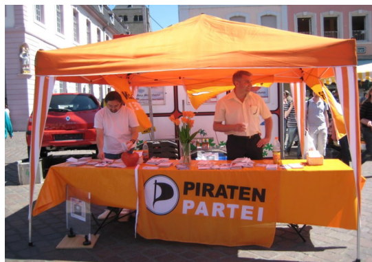
Infostand in Trier