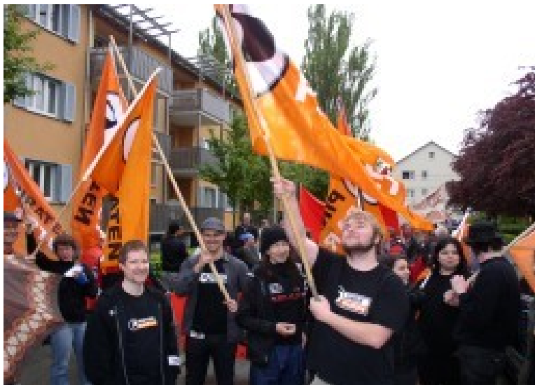
Die Freiburger Piraten schwenken die Fahnen bei der Demonstration des Kaninchenzüchtersvereins.

terschriften u.a. bei einer Unterschriftensammelaktion an einem Samstagmorgen sicherstellen und diese beim Bundeparteitag erfolgreich übergeben. Damit sind wir bisher der erfolgreichste Stammtisch, was das Sammeln von Unterschriften angeht. Zusätzlich waren auch die Elzpiraten hier sehr aktiv und sammelten bisher ebenfalls 89 Unterschriften.