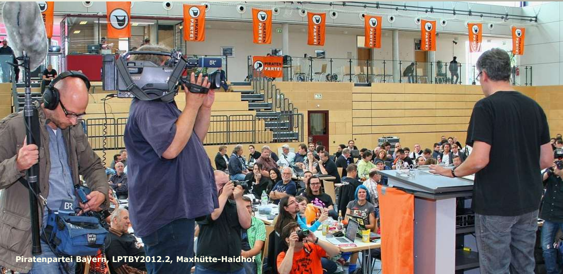
Piratenpartei Bayern, LPTBY2012.2, Maxhütte-Haidhof