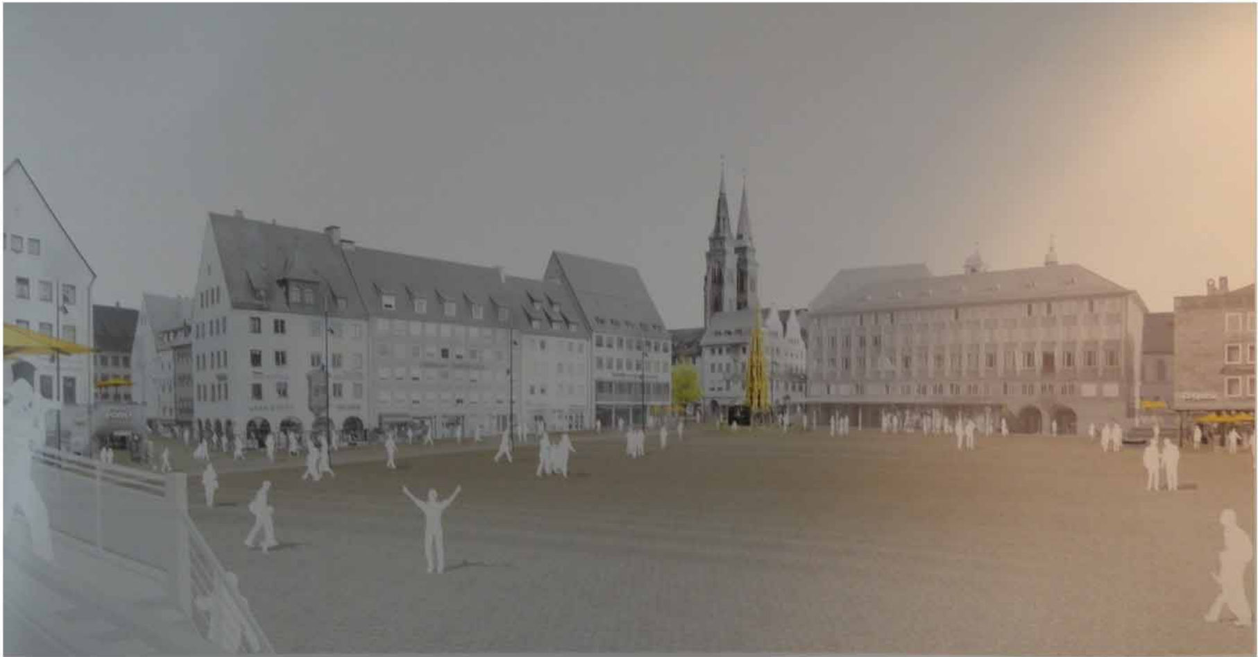
Visualisierung Hauptmarkt 1. Platz