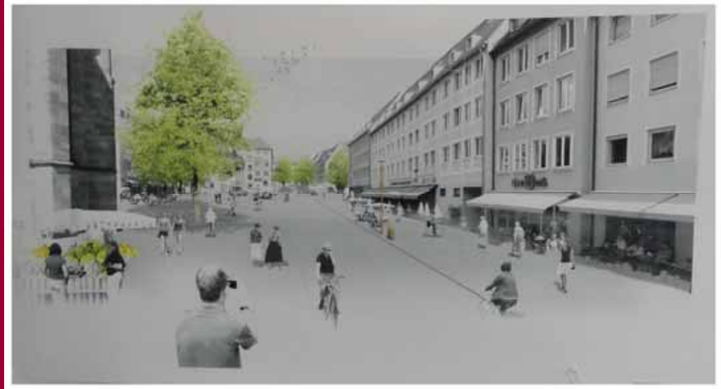
Ausstellung der Entwürfe