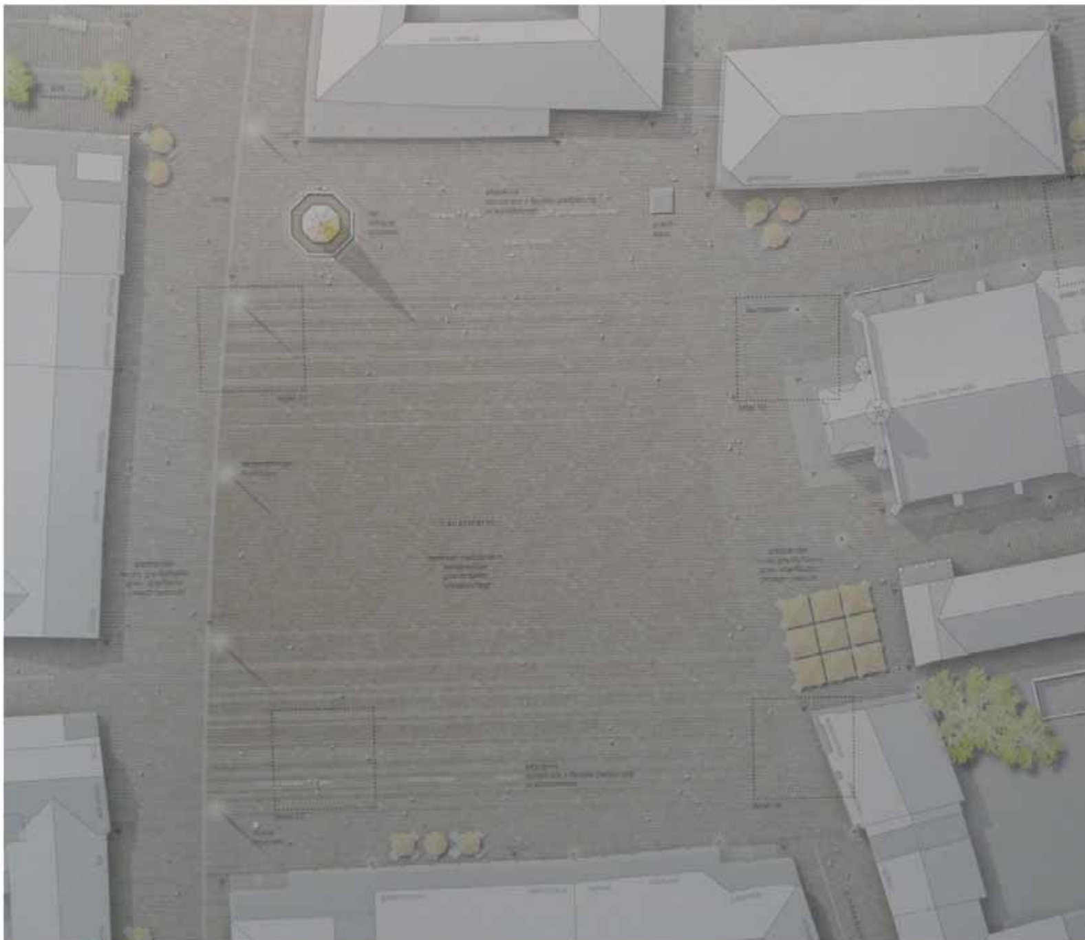
Ausstellung der Entwürfe