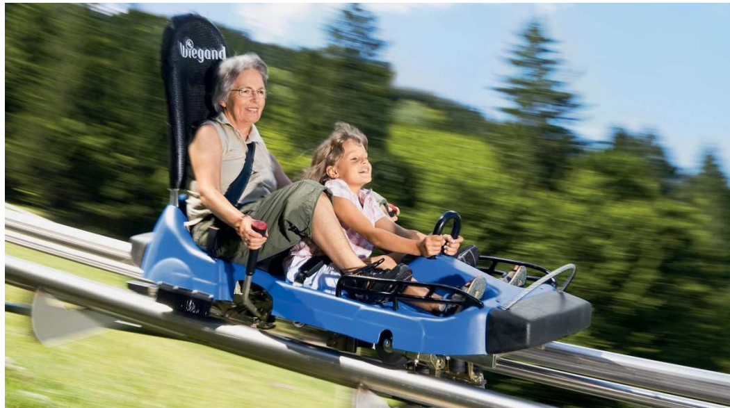
Sommerrodelbahn Großer Feldberg