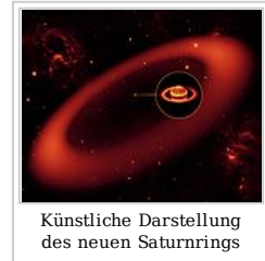
Künstliche Darstellung des neuen Saturnrings

Artikel vormerken ( http://de.wikinews.org/w/index.php?title=Wikinews:Besonders_lesenswerter_Artikel&action=edit&section=3 ) · Neuen Artikel einfügen ( http://de.wikinews.org/w/index.php?title=Vorlage:Hauptseite_Artikel_des_Tages&action=edit ) · Archiv