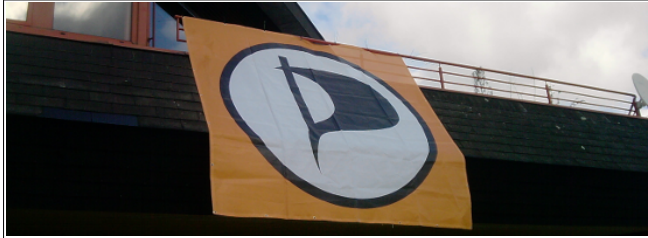
Piratenflagge am Eingang zum Landesparteitag 2012.1 in Osnabrück

Ahoi und herzlich willkommen zur Februar Ausgabe des Landesnewsletters. Diesen Monat mit etwas Verspätung. Arbeitsreiche Wochen liegen hinter den meisten Mitgliedern des Landesverbandes. Zuerst noch im Januar die Vorbereitung auf den Landesparteitag 2012.1, dann ein ganzes Wochenende Vorstandswahlen, Satzungsänderun-