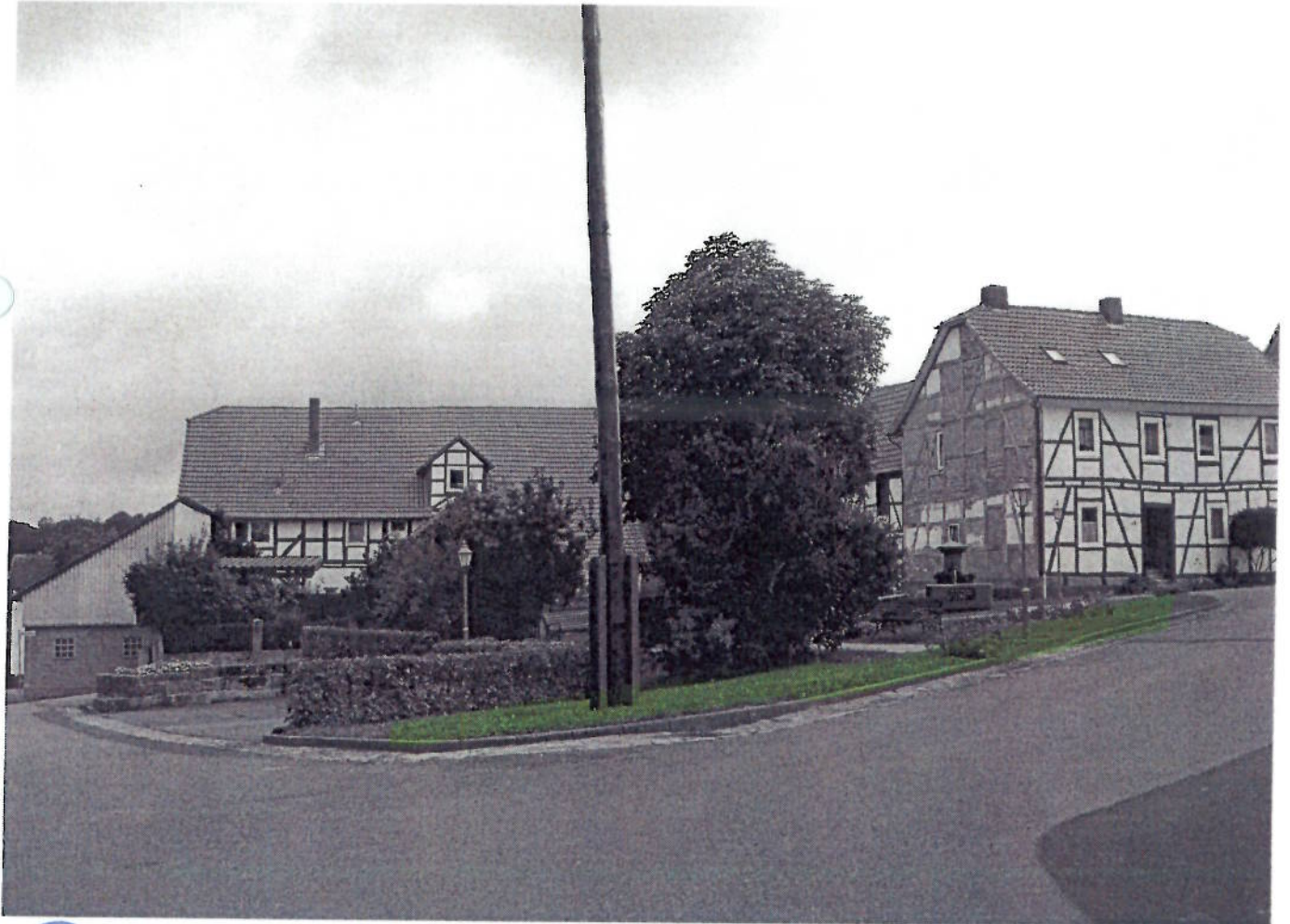
(36) VIE - Landauer Straße (Dorfplatz)