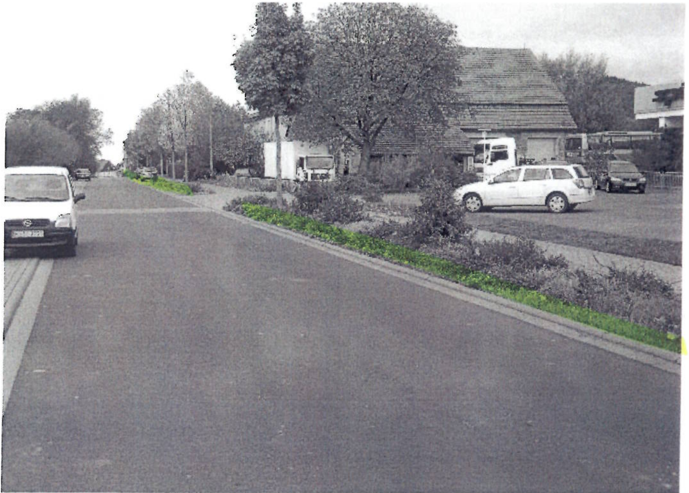
(25) IST - Kasseler Straße (Höhe Autohaus Spöth)