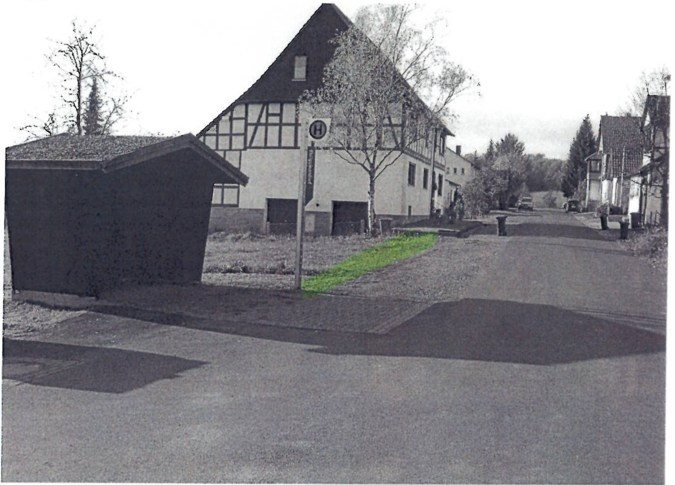
(19) Gasterfeld (Mitte)