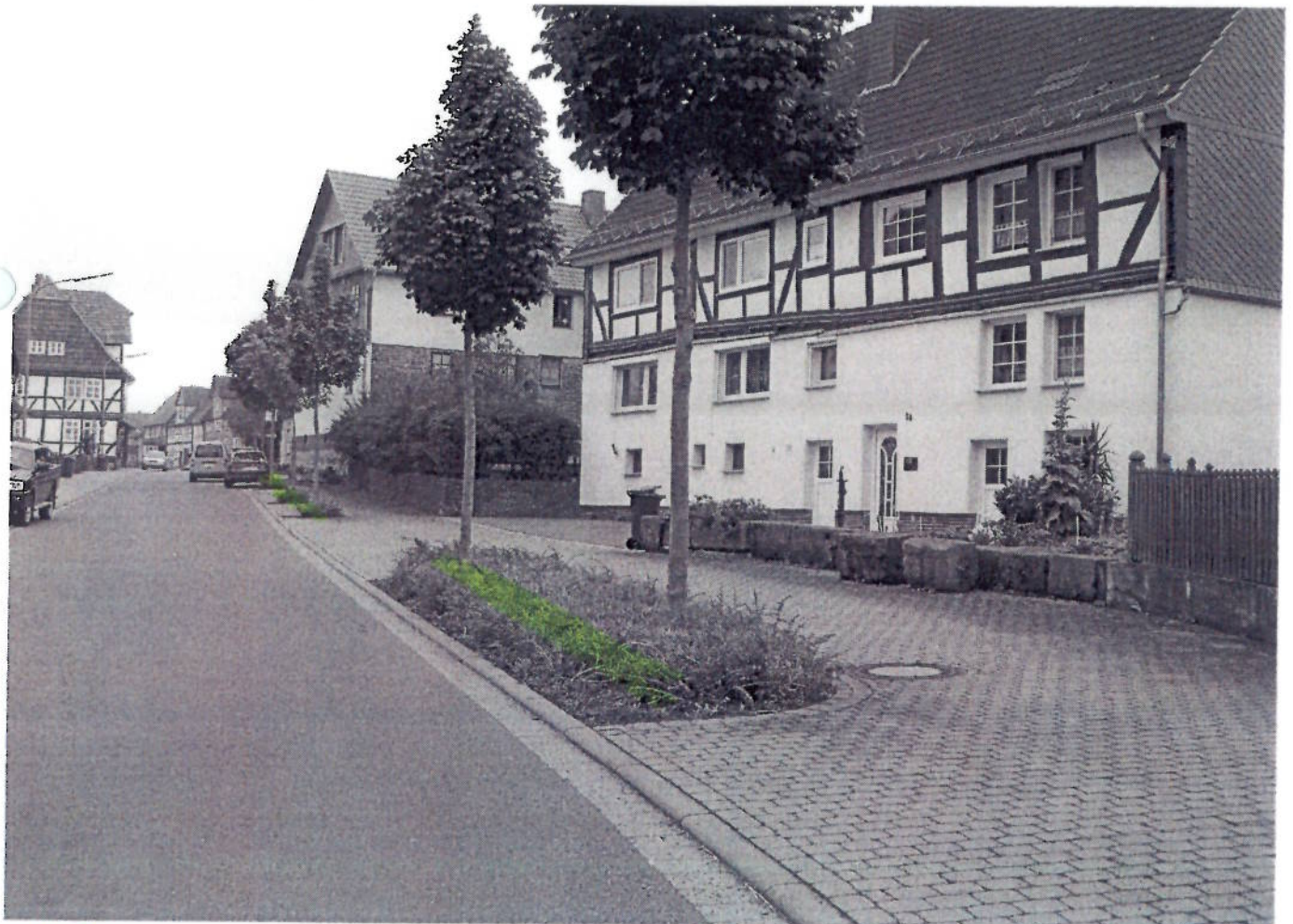
(24) IST - Vasseler Straße (Ortsmitte)