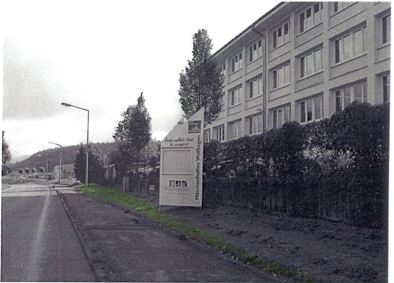
(3) Schützeberger Str. (Ortsausgang richtung Hsitz)