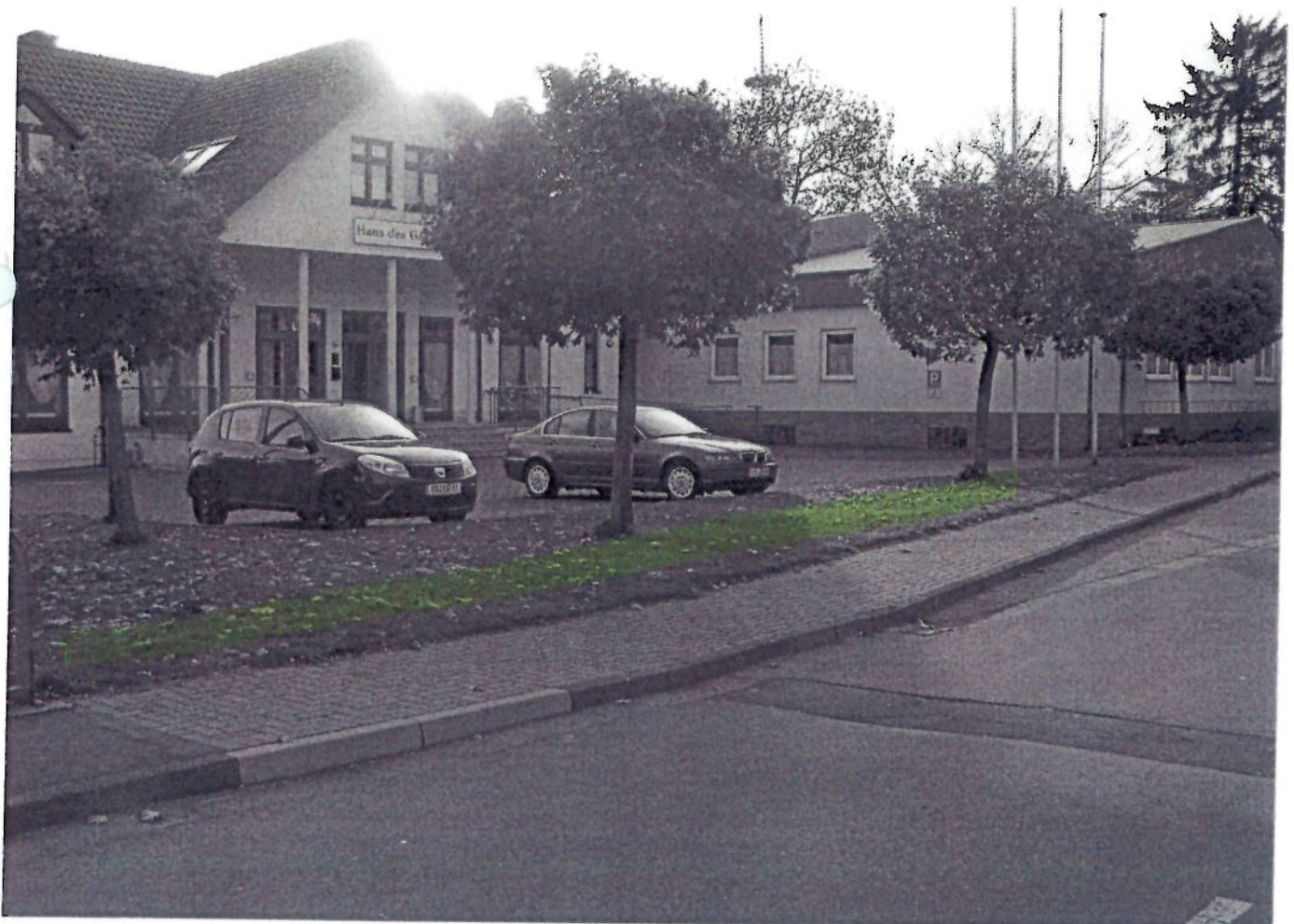
(22) IPP - Leckringhäuser Straße (Höhe DGH)