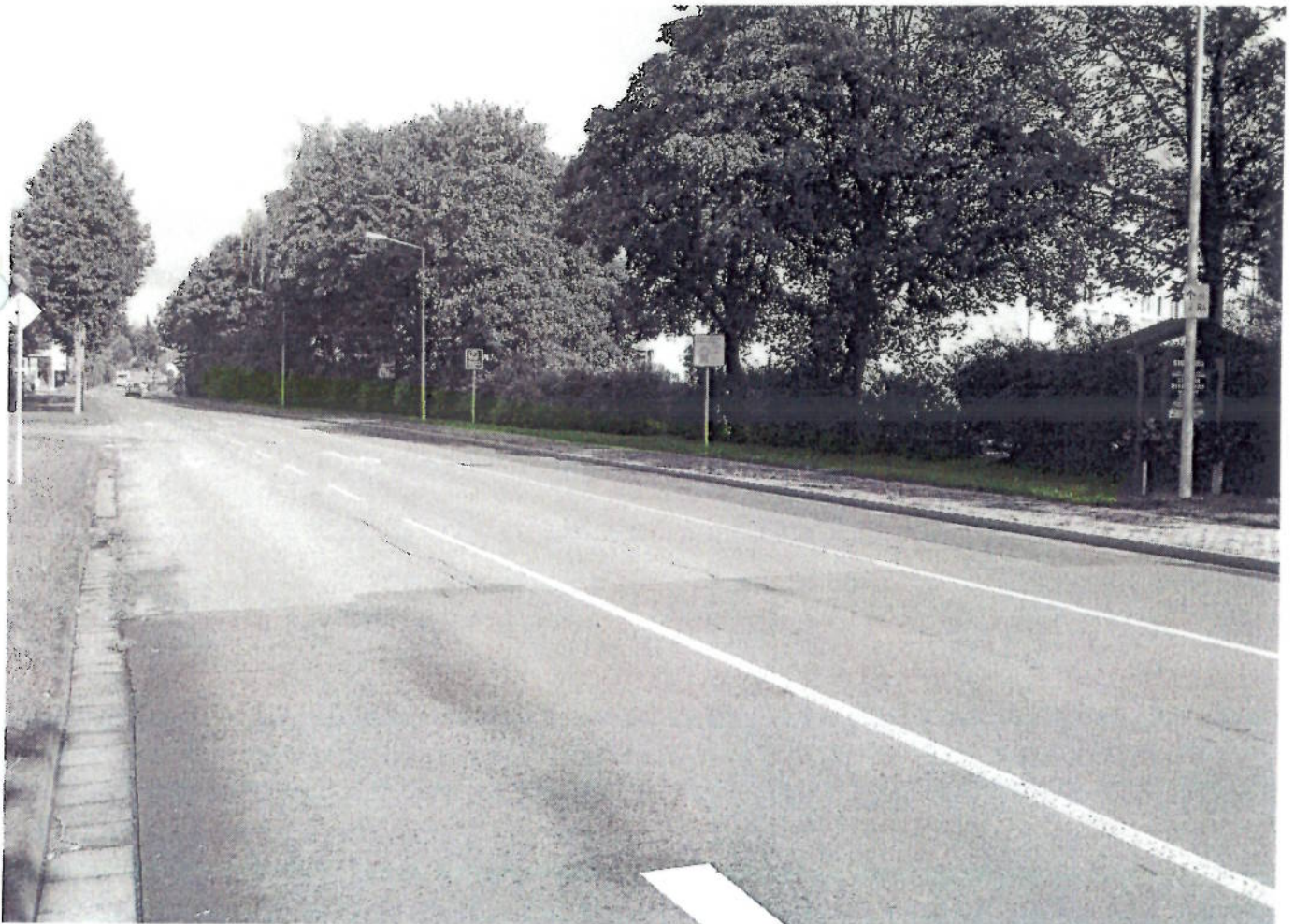
(4) Kurfürstenstraße (ab Magdeburger Str. richtung Tankst.)