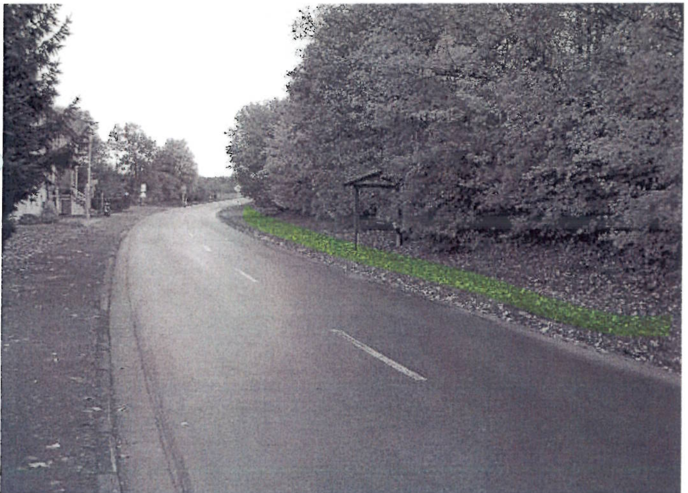
③8 WEN - Erpetalstraße (Richtung Oelshausen)