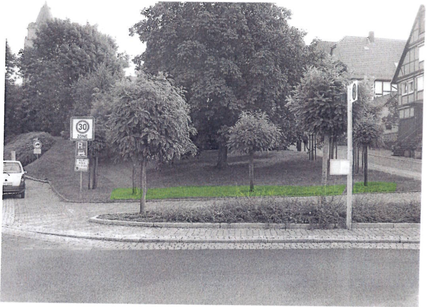
① Ritterstraße (Platz an der Freiheit)