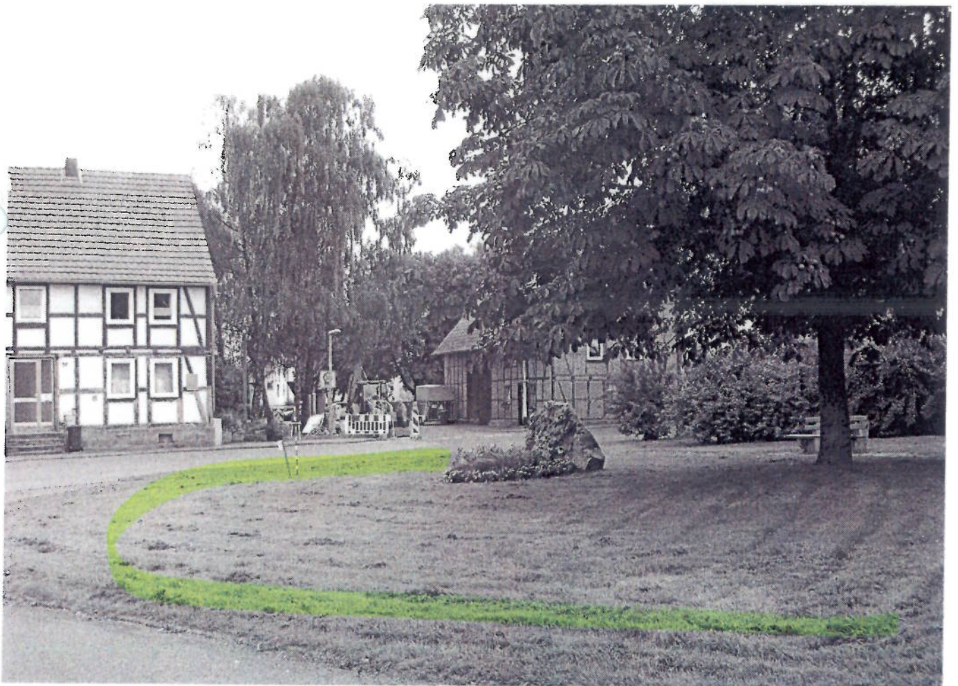
(34) NO - Oberelsunger Straße (Dorfplatz)