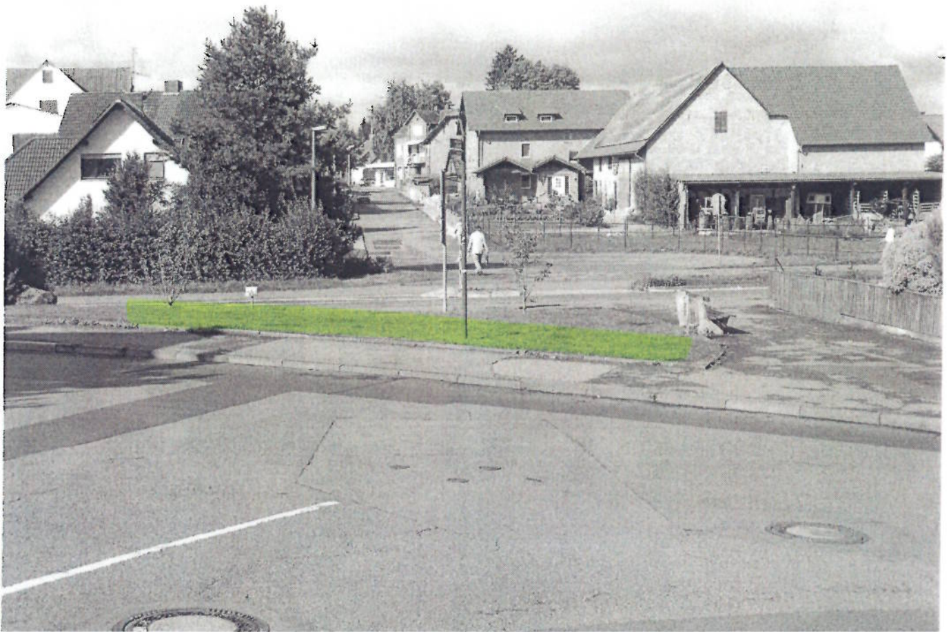
(7) Lynkerstraße (Grünfläche gegenüber Oberbergstraße)