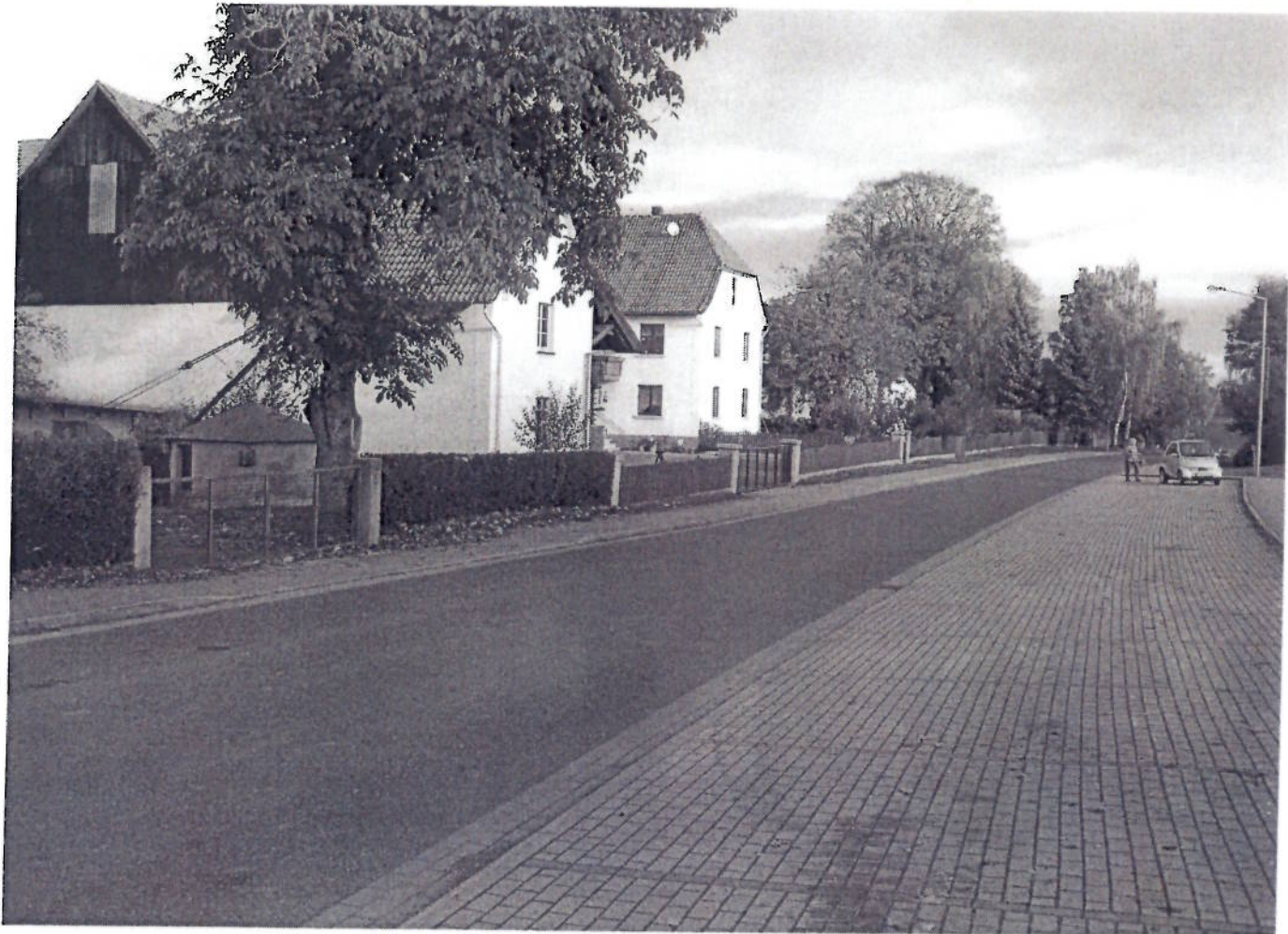
(13) BK - Naumburger Straße (Höhe Festplatz am Lehmloch)