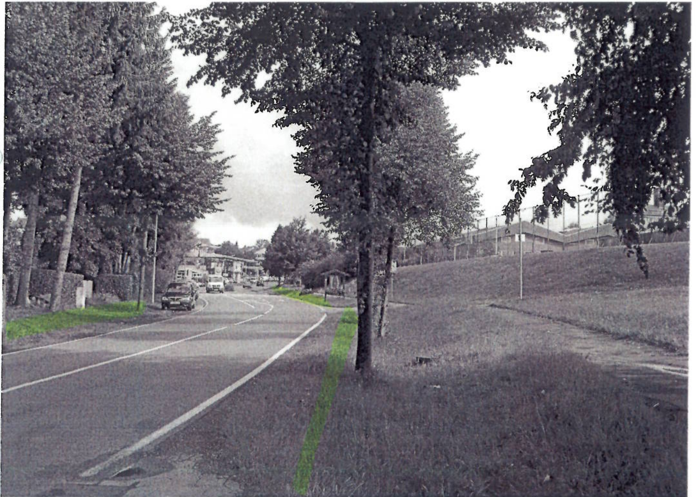
(8) Ippinghäuser Str. (zwischen Butlarstr. + Ortsausgang)