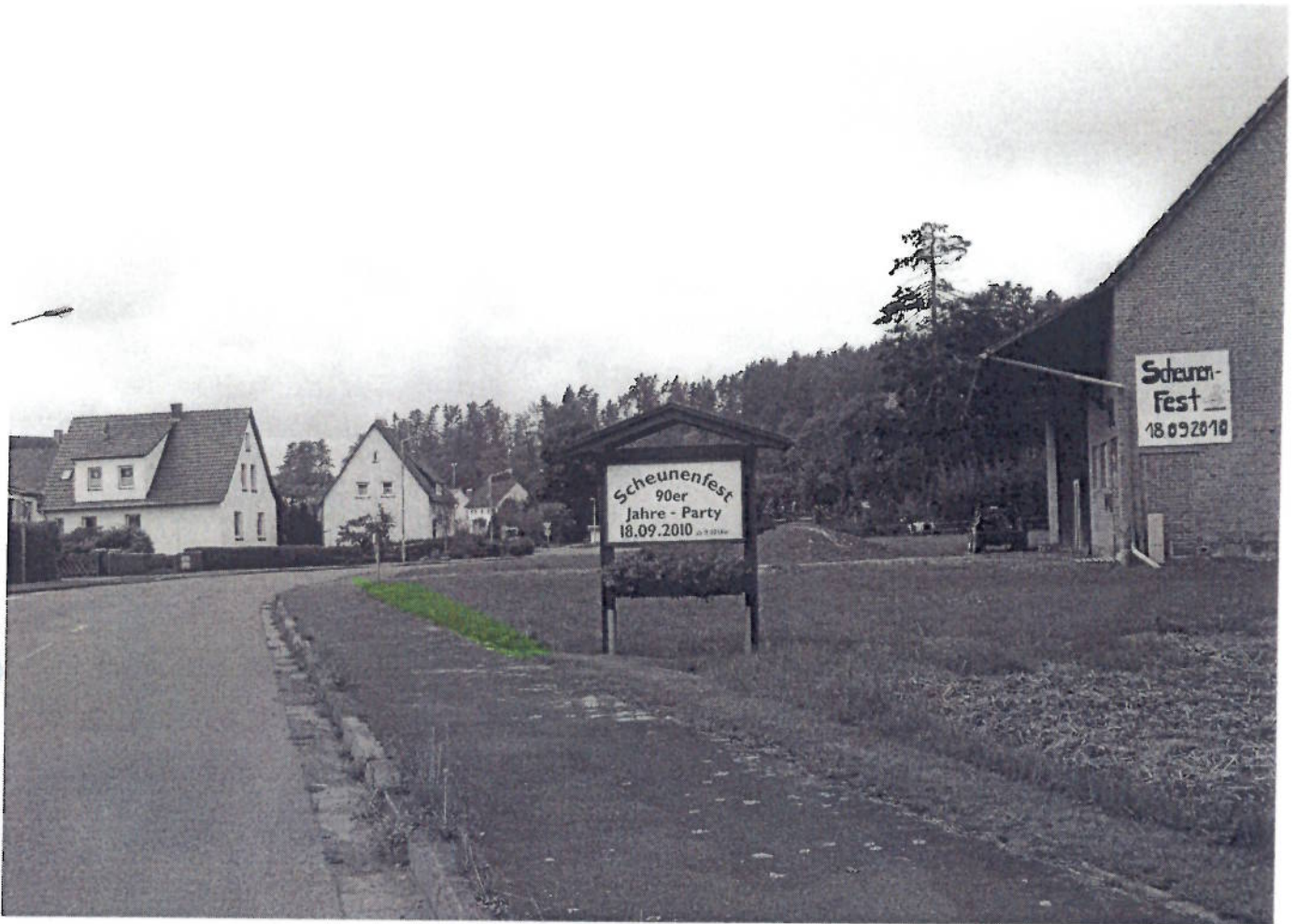
(21) IPP - Waldecker Straße (Richtung Wolfhagen)