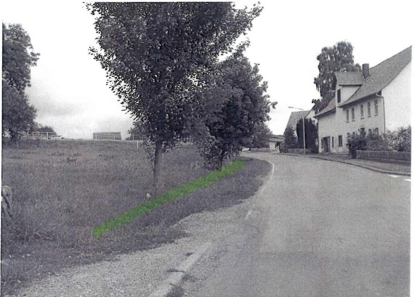
③+ VIE - Wolfthager Straße (Friedhof)