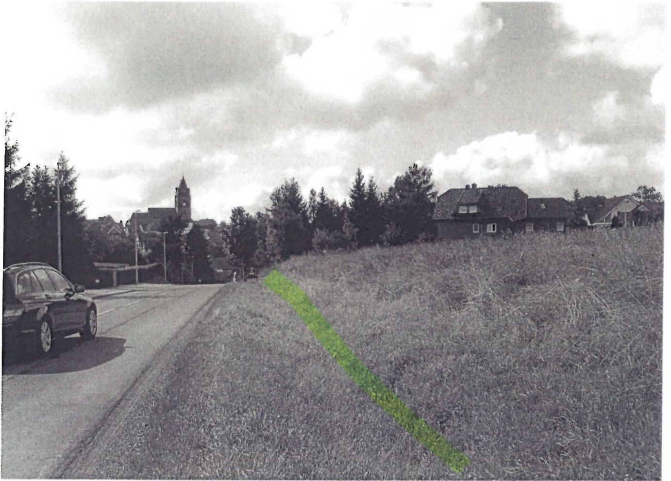
(5) Ehringer Straße (Zwischen Kreisel + Apfeltrift)