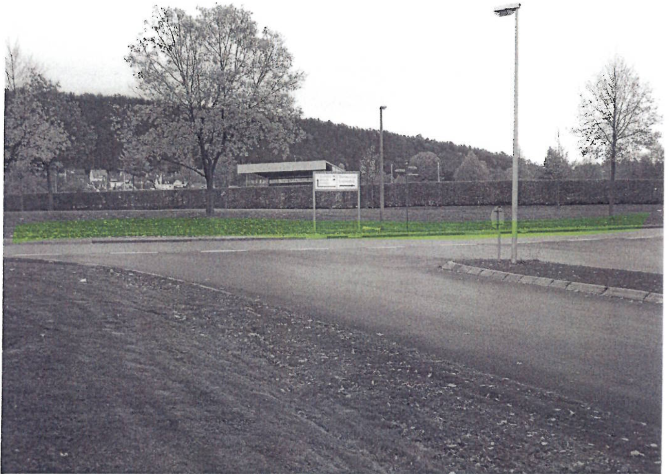
⑨ Sportplatz (Liemcke)