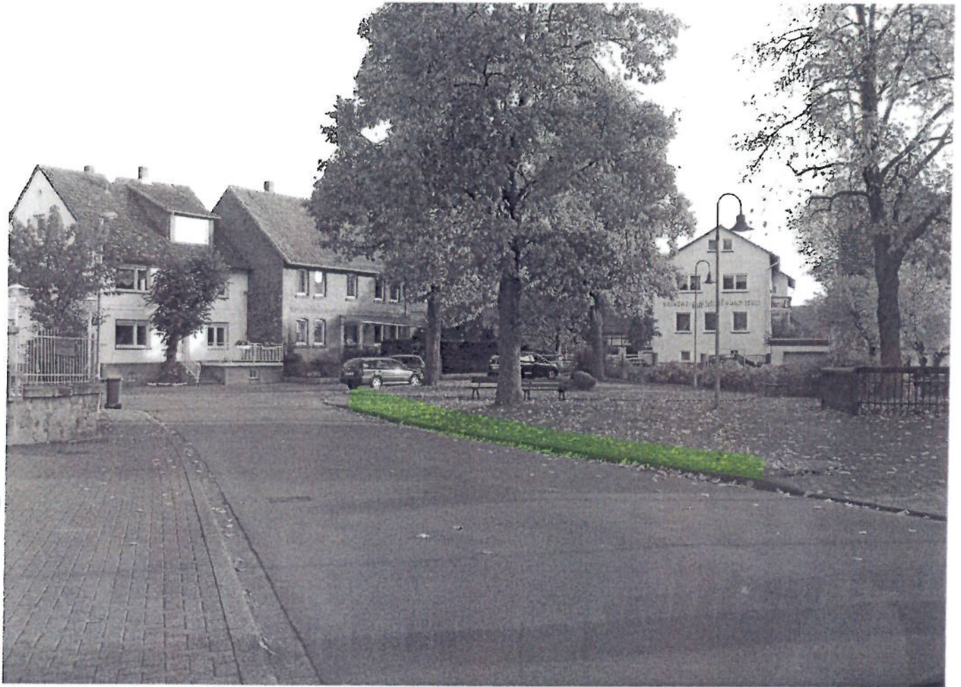
(23) I PP - Gaststätte Heifferling