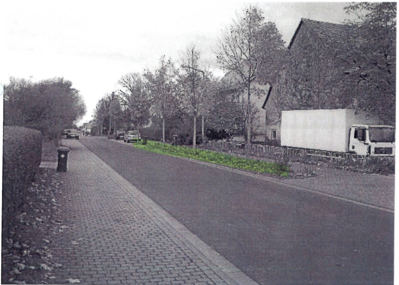
(26) - " -