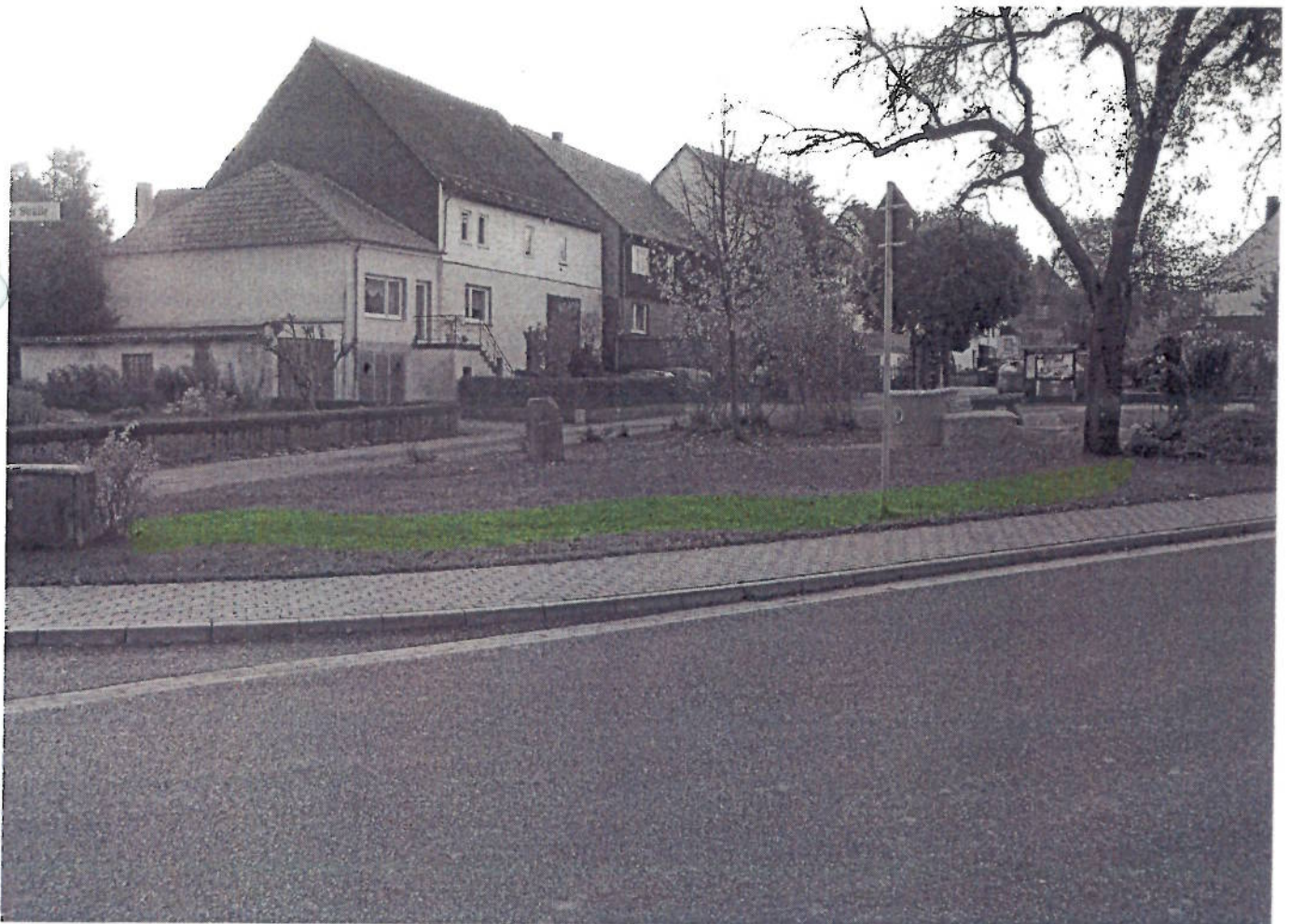
(16) BR - Dorfplatz