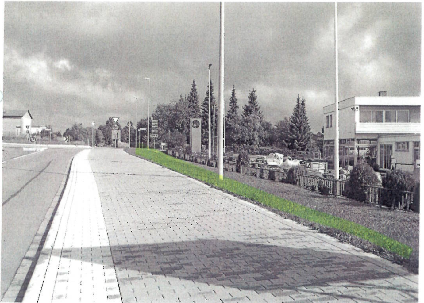
(6) Ehringer Straße (Zwischen Apfeltrift + Kreisel)